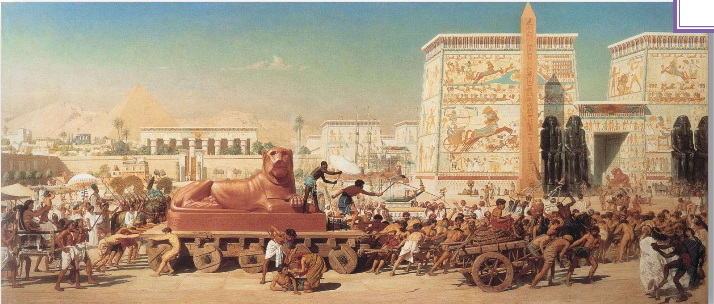
בני ישראל במצרים, אדוארד פוינטר, 1867

בחמשת פסוקים האלו מספר דברים מסופר "על רגל אחת", בקצרה, כל סיפור יציאת מצרים: החל מהירידה למצרים וההשתעבדות למצרים, דרך סיפור יציאת מצרים, ועד הכניסה לארץ ישראל.