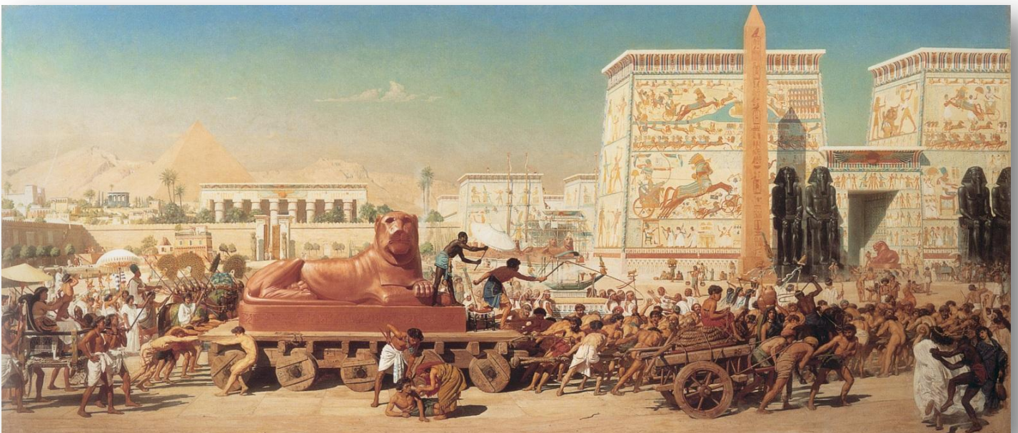
בני ישראל במצרים, אדוארד פוינטר, 1867