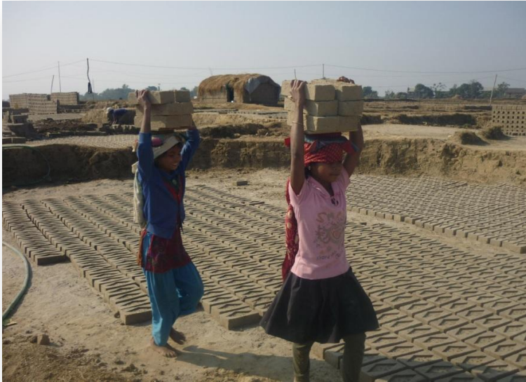
בנות נפאליות עובדות במפעל לבנים

עֲבָדִים הָיִינוּ לַפְּרָעָה בְּמִצְרַיִם, וַיִּוְצֵאֵנוּ יי' אֱלֹהֵינוּ מִשָּׁם בְּיַד חֲזָקָה וּבְזִרְזָע נְטוּיָה. וְאֵלּוּ לֹא הוֹצֵא הַקְּדוֹשׁ בְּרוּךְ הוּא אֶת אֲבוֹתֵינוּ מִמִּצְרַיִם, הֲרִי אָנוּ וּבְנֵינוּ וּבְנֵי בְנֵינוּ מִשְׁעַבְדִּים הָיִינוּ לַפְּרָעָה בְּמִצְרַיִם.